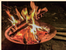
レンタル焚き火台